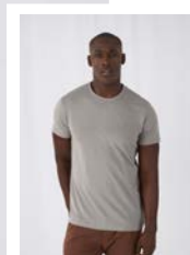
DUO CONCEPT con B&C Organic Inspire T /men